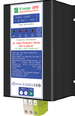
제품리스트 A-3 (W)140 x (L)226 x (H)90