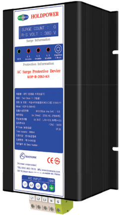
제품리스트 A-2 (W)140 x (L)276 x (H)90