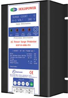
제품리스트 C-1 (W)140 x (L)190 x (H)70