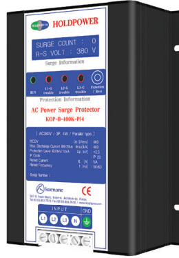
제품리스트 C-2 (W)140 x (L)190 x (H)90